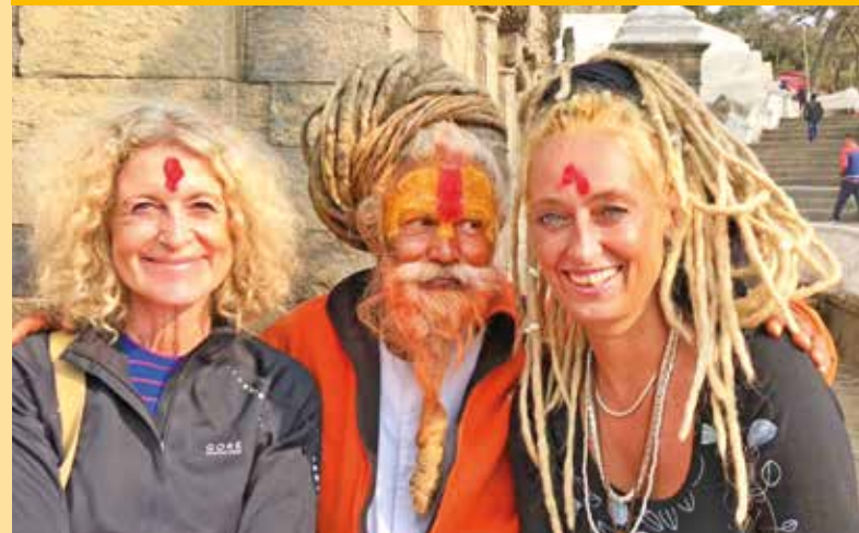
Besuch bei einem Sadhu