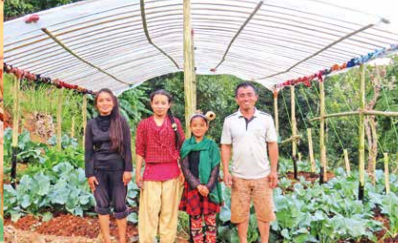
Einfache Gewächshäuser verbessern Ernährung und Einkommen.

Der einzige Weg führt nun über die Serpentin der kleineren Berge und unzählige staubige Lehm-pisten, die ohne Zweifel die Traum-Heimat für jedes Schlagloch der Welt sind, das etwas auf sich hält. Stundenlang werden alle im Jeep durcheinander geschüttelt. Die Straßen sind oft so eng, dass der Gegenverkehr nicht an uns vorbeikommt. Manchmal kommt es dann zum störrischen Kräfte-messen, welcher Fahrer wohl zuerst den Wettstreit um die Vorfahrt aufgibt und schließlich doch zurücksetzt, um den anderen vorbeizulassen.