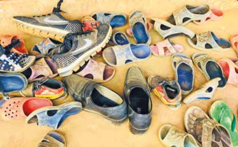
Vor Eintritt ins Klassenzimmer: Schuhe ausziehen!