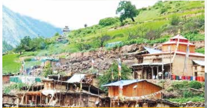
Bald die Hälfte des Dorfes wurde zerstört.