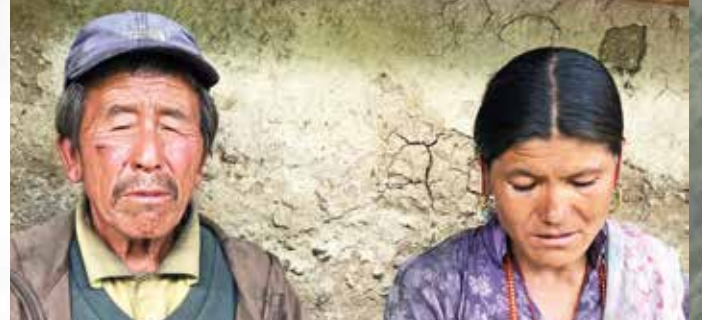
Seine Frau wäre beinahe in den Flammen umgekommen.

erschöpft und mittellos, um diese Aufgabe aus eigener Kraft zu bewältigen. Niemand wird sich sein Haus ohne Hilfe von außen wieder aufbauen können. Nach Rücksprache mit den restlichen Vorstandsmitgliedern und unserem Team vor Ort habe ich deshalb nun entschieden, dass Back to Life das Dorf Kimri deutlich stärker als geplant unterstützen wird: durch den Wiederaufbau aller 19 abgebrannten Häuser. Es wird somit das größte Bauprojekt in der Geschichte von Back to Life werden. Zudem bedeutet es eine extrem große logistische Herausforderung, da Materialien nur unter größten Kraftanstrengungen zu Fuß über die Berge nach Kimri gebracht werden können und versierte Bauarbeiter in dieser Gegend nur wenige zu finden sind.