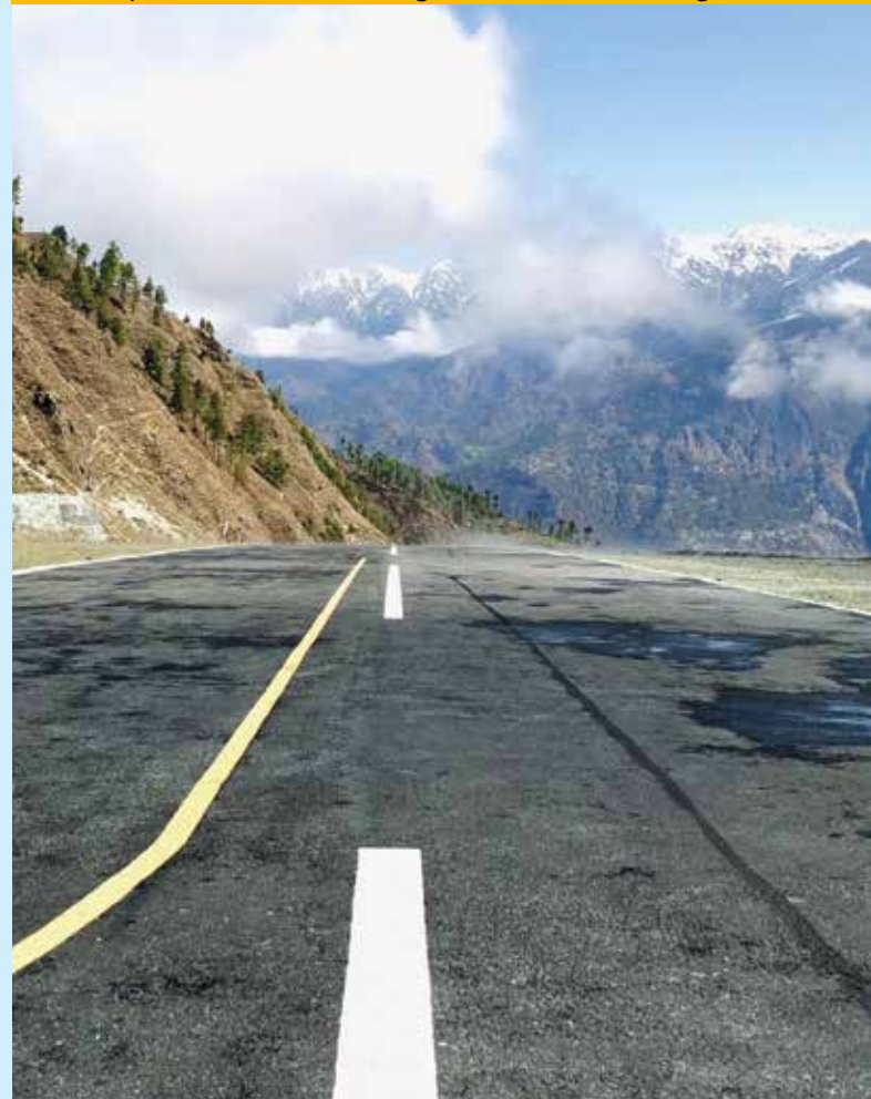
Startbahn des Tacha Airports. Nichts für schwache Nerven