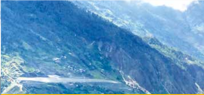
Tacha Airport, eine Landebahn in den Bergen