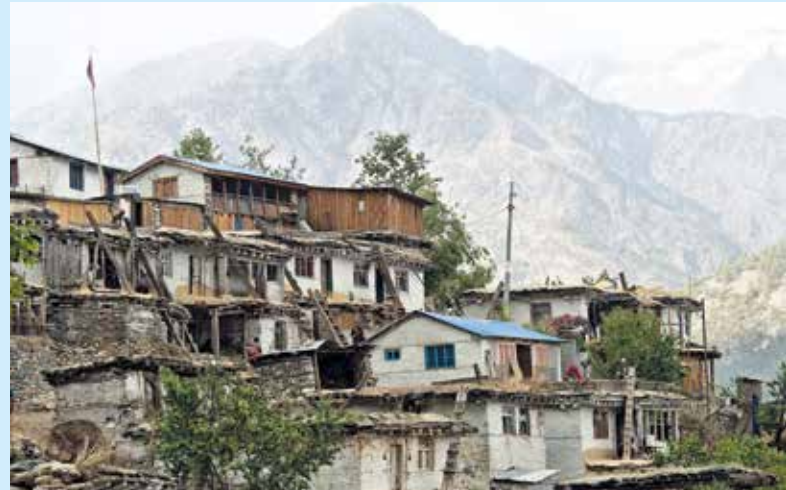
Loharbada war der letzte Ort auf unserer Reiseroute.

Hier hat sich in den letzten Jahren enorm viel verändert. In bald einem Jahrzehnt Projektarbeit mit der lokalen Bevölkerung kann man täglich mitverfolgen, wie der Fortschritt mehr und mehr Einzug hält. Gab es bis vor ein paar Jahren noch kaum Geschäfte und nur ein Hotel, so sind die Marktstraßen der Stadt nun mit vielen kleinen und auch ein paar größeren Läden überseht, mehrere Hotels stehen zur Auswahl um Reisende aufzunehmen und das alte Hospital weicht zurzeit einem für Mugu-Verhältnisse ziemlich großen Neubau. Diese Klinik wird die medizinischen Standards in der Region deutlich verbessern und auch für unsere Arbeit sehr wichtig werden, wenn wir wieder einmal einen Notfall aus den Bergen versorgen müssen. Vielleicht wird es dann nicht mehr nötig sein, jeden Notfallpatienten auszufliegen, wenn kompetente Ärzte und genügend technisches Equipment im Krankenhaus zur Verfügung stehen. Manche Kranke schlepten sich in den letzten Jahren mit letzter Kraft aus den Bergen dorthin, um schließlich nach 2 Tagen kraftraubendem Weg über die Berge festzustellen, dass zuzeit überhaupt kein Arzt vor Ort ist, um ihnen zu helfen. Für nicht wenige bedeutete das den sicheren Tod.