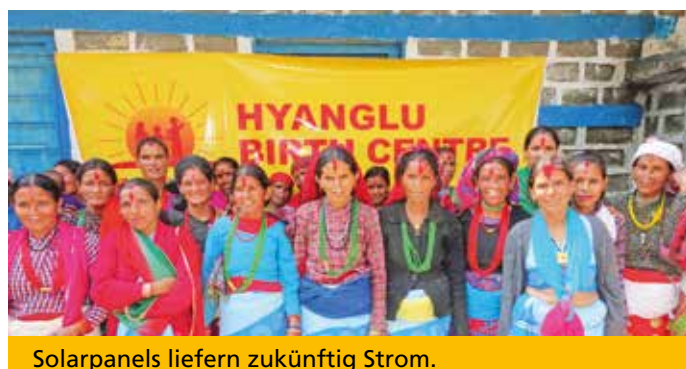
Solarpanels liefern zukünftig Strom.

Zur Zeit gibt es 14 schwangere Frauen in Hyanglu, die sich mit Unterstützung durch unserer erfahrenen Hebamme auf die Geburt vorbereiten. Zwei Geburten wurden bereits erfolgreich durchgeführt, insgesamt gibt es nun bereits 742 „Back to Life-Babys“. Weder Kuhställe noch Erdlöcher im Wald müssen nun länger als Rückzugsort zur Verfügung stehen. Unser Konzept der „neutralen“ Geburtshäuser respektiert den Glauben der Menschen, dass es Unheil bringt, im eigenen Haus Blut zu verlieren. Auch, wenn es offiziell in Nepal mittlerweile verboten ist, diesen lebensgefährlichen Traditionen nachzugehen, werden sie doch immer noch in vielen Distrikten praktiziert. Um die hohe Säuglings- und Müttersterblichkeit weiter zu reduzieren, planen wir deshalb mittlerweile unser 13. Geburtshaus in Mugu. Schritt für Schritt kommen wir unserem Ziel näher.