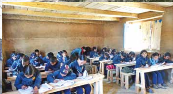
Endlich Tische und Sitzplätze für alle!

bisher unvorstellbar waren, erscheinen den Kindern plötzlich greifbar. Mit dem neuen Gebäude wurde somit bereits ein erster wichtiger Meilenstein erreicht: Selbstvertrauen, das eigene Schicksal ändern zu können.