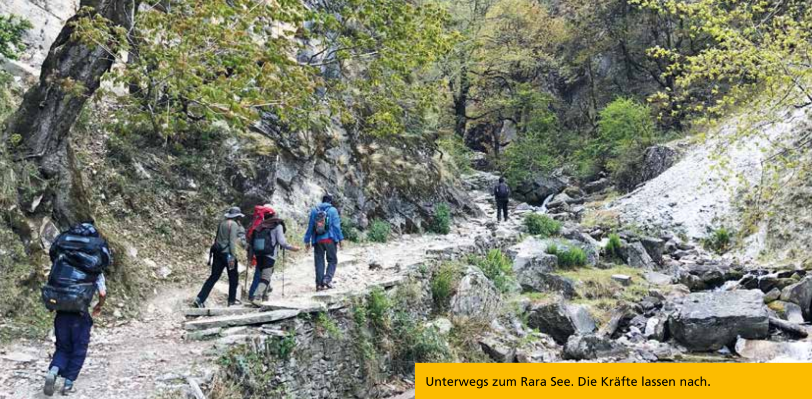
Unterwegs zum Rara See. Die Kräfte lassen nach.

Nach einem schnellen Frühstück brechen wir auf. Diesmal zu Fuß, denn noch halten wir es für eine ausgesprochen gute Idee, nicht länger im schaukelnden Jeep sitzen zu müssen. Wir werden etwas später unsere Überzeugung dazu revidieren... Unser Etappenziel ist das Geburtshaus von Seri, einem unser ältesten Geburtshäuser. Die Sonne brennt unbarmherzig auf uns herab, aber die Landschaft ist traumhaft. Der Feldweg zieht sich durch die Täler und nach ca. 2 Stunden kommen wir an dem kleinen JTAM-Waisenhaus vorbei, dass auch von Back to Life unterstützt wird – 6 Kinder haben hier ein neues Zuhause gefunden. Wir werden auch musikalisch begrüßt, drei Jugendliche schlagen spontan und lautstark die traditionellen Trommeln für uns. Die obligatorische Einladung zur Teepause im Haus schützt uns eine Weile vor der Hitze, die lebendigen Gespräche bringen jedoch auch unseren Zeitplan etwas durcheinander – sofern man so etwas in Mugu überhaupt haben darf, denn die Zeit hat hier ihre eigenen Gesetze. Im Dorf Seri besichtigen wir schließlich das 2. Geburtshaus von Back to Life. Im Vergleich zu unseren moderneren Bauten der letzten Jahre ist es etwas kleiner und unscheinbarer angelegt. Gleichwohl bietet es die höchste Anzahl an Neugeborenen: Insgesamt schon 279 Kinder – das ist der interne Rekord unter all unseren Geburtshäusern!