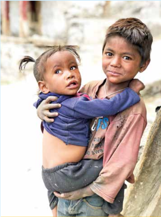
Trost beim großen Bruder suchen (Loharbada)

ist ein unberührtes Juwel und gehört zu den beeindruckendsten Landschaften Nepals. Jugendliche reiten auf kleinen Ponys zum Zeitvertreib an uns vorbei. Ein paar Kilometer vom See entfernt, holt uns schließlich ein Jeep ab und bringt uns nach Gamghardi, der Hauptstadt der Region Mugu.