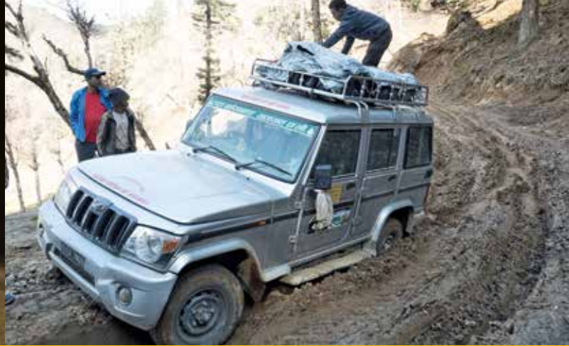
Steckengeblieben. Nichts geht mehr