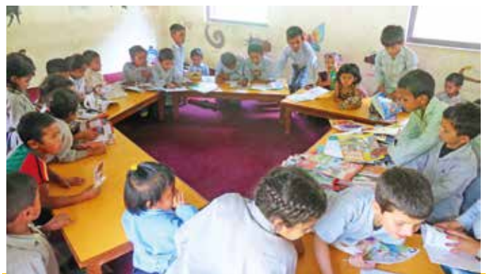
Die Kinder sind begeistert von den neuen Büchern.