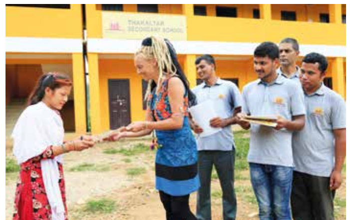
Übergabe der Urkunden

Was sie sich wünschen würden, wenn ein Engel ihnen einen Wunsch ermöglichen würde? „Ich wünsche mir ein schönes Haus, das richtig ausgestattet ist.“ „Bitte einen Zauber, der es mir ermöglicht, von jedem Studienfach 100% des Wissens im Gehirn abzuspeichern!“ „Ich fände es toll, wenn es einen Service gäbe, der Einkäufe nachhause bringt.“