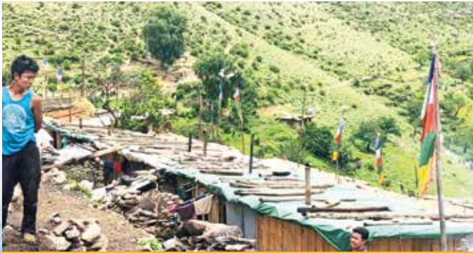
Behelfsbaracke für die Familien