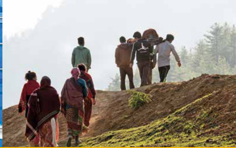
Getragen von den Angehörigen, der Weg ist zu weit.

bereitwillig hinterher. Es kann nach fast einer Stunde endlich weitergehen. Alle klatschen sich zu. In Mugu leben, heißt Gemeinschaft leben.