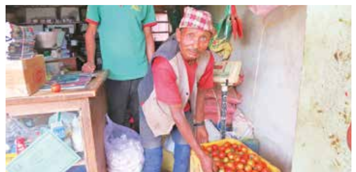
Kleine Läden kaufen die frischen Tomaten direkt ab.

Wir achten bei der Wahl der Tomatensamen auch darauf, keine Abhängigkeiten zu Großkonzernen oder anderen Ländern aufzubauen: Die Sorte „Srijana“ wird in Nepal selbst herangezogen und ist praktisch überall erhältlich. Das wird den Aufbau der lokalen Wirtschaft unterstützen und Nepal in kleinen Schritten vom Gemüse-Import aus anderen Ländern unabhängiger machen. Die wachsende Bevölkerung kann mit den derzeitigen Anbauflächen noch nicht ausreichend versorgt werden – der Himalaya-Staat beherbergt insgesamt bereits 29 Millionen Einwohner.