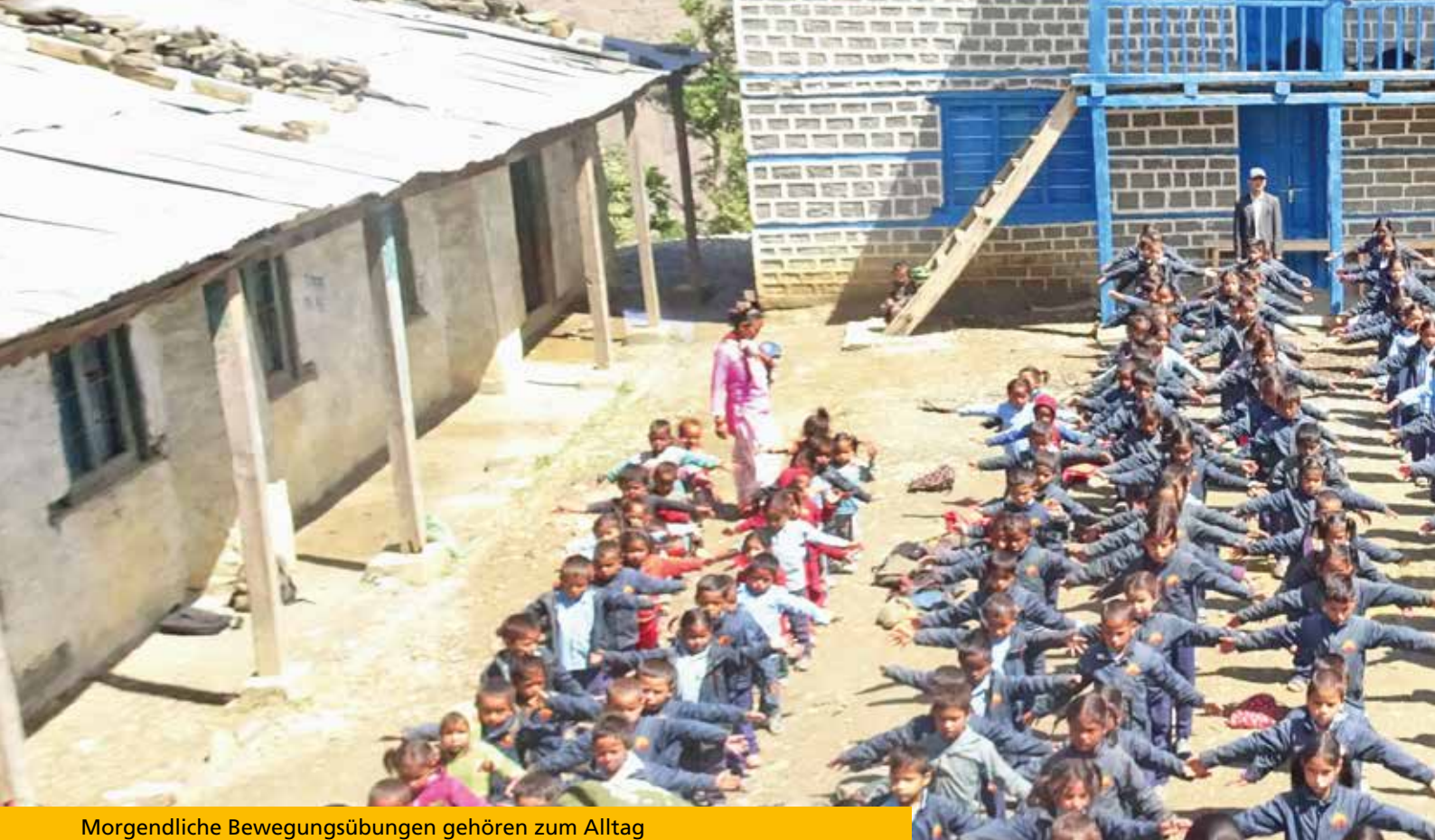
Morgendliche Bewegungsübungen gehören zum Alltag