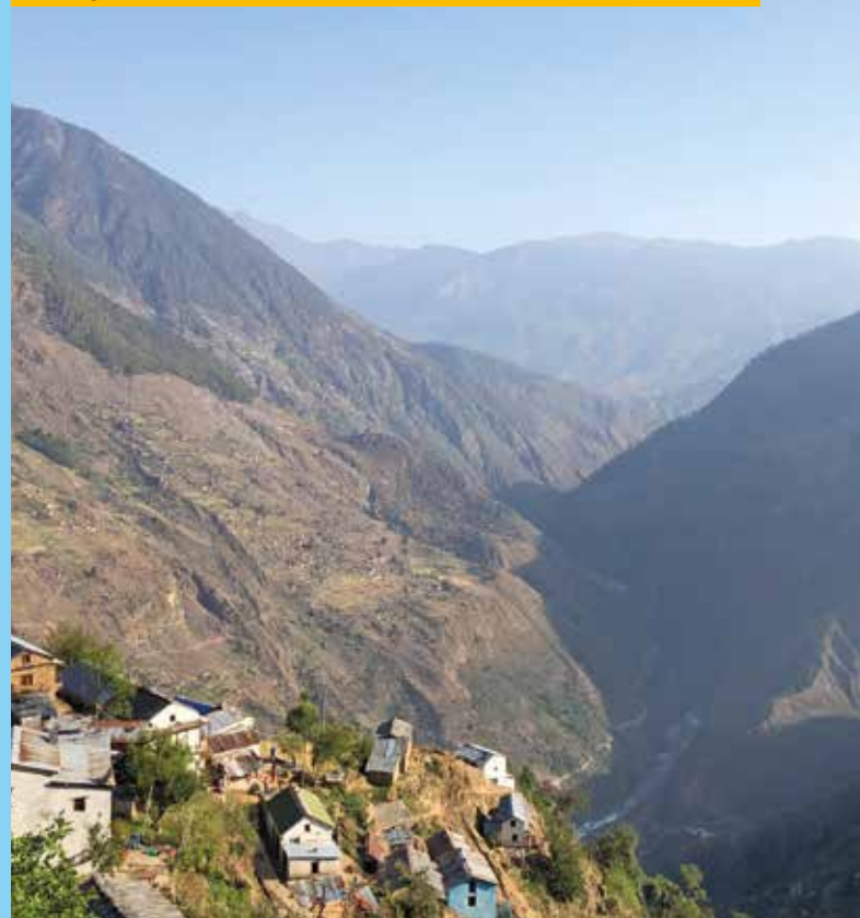
Morgendlicher Ausblick ins Tal von Kalikot.

Hoffnungsvoll rufen wir am nächsten Morgen den Flughafen an und erkundigen uns, ob das Flugzeug repariert wurde. Ja, heißt es am anderen Ende der Leitung, Maschine und Wetter seien ok, wir sollen kommen. Am Flughafen checken wir ein und warten in der Abflughalle. Nach 2 Stunden landet endlich der verspätete Flieger aus Mugu, wir freuen uns, dass es endlich losgehen kann. Doch als die Piloten aussteigen, schütteln sie nur mit dem Kopf, das Wetter hat sich – wie so oft – über den Bergen schlagartig verschlechtert. Aufgetürmte Wolkenbarrieren verhindern jegliche klare Sicht, ein Flug wäre nicht nur lebensgefährlich sondern Irrsinn. Frustriert sitzen wir erneut fest und überlegen, welche Optionen wir noch zur Verfügung haben – denn auch am nächsten Tag könnte uns das gleiche Schicksal widerfahren. Wir beschließen, einen Jeep zu mieten. Uns ist zwar klar, das dies für uns – statt eines gerade mal 50 minütigen Flugs – nun zwei volle Tage durch zum Teil sehr unwegsames Gelände bedeuten wird, doch wir ahnen noch nicht, wie kraftraubend es tatsächlich werden wird. Zudem wollen wir auch nicht das Risiko auf uns nehmen, noch weitere Tage durch Warten zu verlieren. Eine gute halbe Stunde später verlassen wir die Stadt in Richtung des Gebirges.