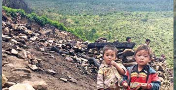
Zuhause in den Trümmern.

Back to Life-Spendenkonto: IBAN DE 94 500 800 000 729999002 / BIC DRESDEFFXXX