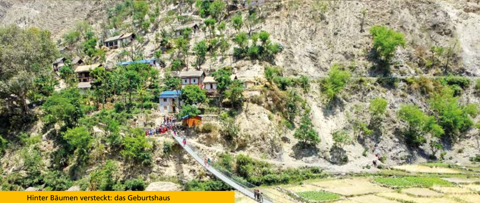
Hinter Bäumen versteckt: das Geburtshaus