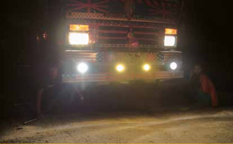
Die Straße blockiert. Radwechsel bei Nacht