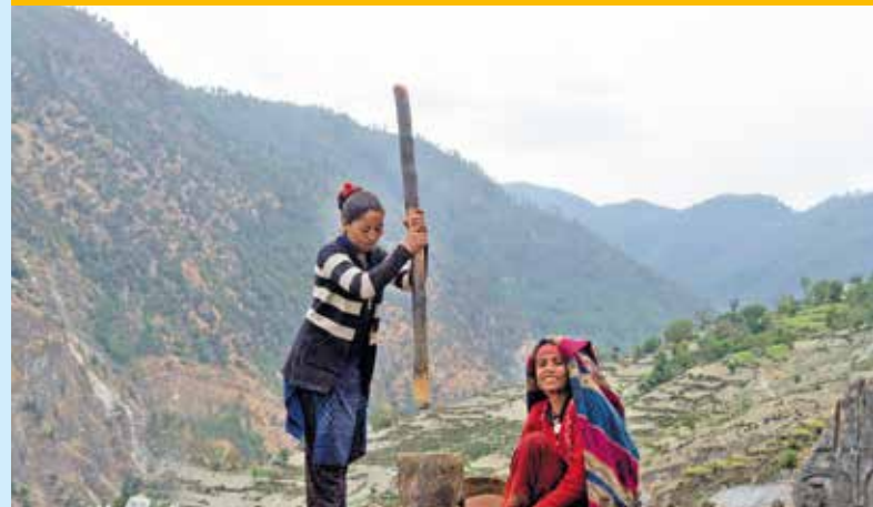
Zerstampfen des Getreides – tägliche Prozedur in Mugu