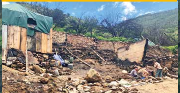
Abgebrannt bis auf die Grundmauern: 19 Häuser