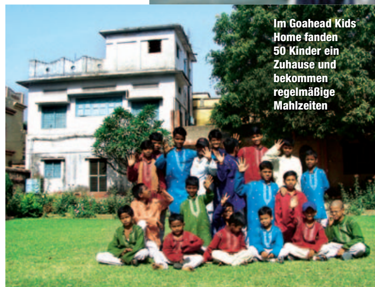
Im Goahead Kids Home fanden 50 Kinder ein Zuhause und bekommen regelmäßige Mahlzeiten