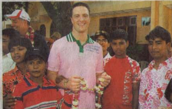
▲ Ralf Schumacher (31) mit Waisenkindern im Kinderheim „goahead Kids Home“. Für den prominenten Besuch aus Deutschland hatten sie extra eine Kung-Fu-Show einstudiert

macher wollen die Kinder von Benares in Zukunft gemeinsam unterstützen. Mit Spenden, Sponsorensuche und weiterem Engagement vor Ort.